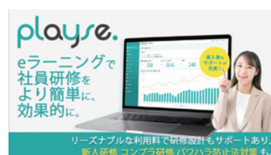
社員教育プラットフォーム 「playse.ラーニング」

「playse.ラーニング」は5,300レッスン以上の豊富なeラーニング教材を搭載しています。豊富なジャンルの教材が揃っているので、階層別研修から職種別研修、コンプライアンス研修、ハラスメント研修、情報セキュリティ研修、IPO研修、リスキングまで様々な研修にご活用いただけます。更に、お客様からの「自社のナレッジを動画にしてeラーニングで共有したい」というお声から、お客様自身が手軽に「動画編集」や「外国語翻訳」ができる「Vrew（ブリュー）」を管理者画面からアクセスできるように提携しております。