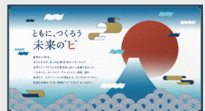
共和レザー 90周年広告