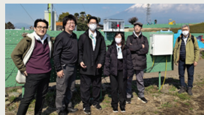
私たちは現場に行くことから始めます

その他 ..... ISO9001:2015 認証取得 / ISO17100:2015 認証取得 / 全省庁統一資格取得 / 一般労働者派遣事業 / 保有知財 国内: 特許 27 件、商標 26 件、実用新案 1 件 米国: 特許 7 件、商標 6 件 ドイツ: 商標 6 件 スイス: 商標 7 件 中国: 特許 9 件、商標 11 件