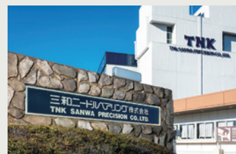
つくば本社の正門にて

その他 ..... ISO9001、14001、13485 認証取得 / IATF16949 認証取得 / 医療機器製造業(2025) / 健康優良企業(認定番号:5001) / 優良表彰 品質賞(2013年デンソー様) / 総智・総力賞(2024年デンソー様)