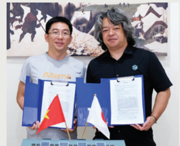
Alternō社との基本合意契約締結の様子

その他 ..... 2023年3月 IBARAKI Next Space Pitchにて準グランプリを受賞 / 2024年2月 県北BCPアイデアソン2023最終報告会にて茨城県知事賞を受賞 / 2025年8月 JETROの対内直接投資促進事業費補助金を獲得。