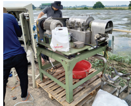
自社開発したコンパクトな可搬式遠心分離機

自社開発した可搬式超高速遠心分離機の重量は約100kgで、メコンデルタの複雑に入り組んだ水路の先にある養殖場にも持ち運ぶことができます。脱水した汚泥は資源として有効活用します。当社は、この汚泥とその地域の農業系廃棄物を組み合わせ、農業資材として地域の農家へ還元することで、資源循環の仕組みを構築しています。一方、現地の一次産業は、汚泥の他、水質悪化や水量減少、温暖化などを背景に、生産方式の転換期を迎えています。現地企業や行政とも連携しながら課題解決を図り、メコンデルタでの事業展開を進めます。